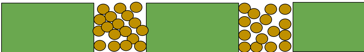
Figur 1 Skitse af levende hegn

Hegnet vil blive etableret med 4m levende hegn efterfølgende 2m insekthotel, bestående af træstammer i 60 cm dybde, efterfølgende 4m levende hegn og herefter 2m insektheqn, se nedenstående skitse.