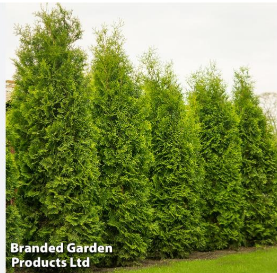
Figur 2 Thuja Brabant hæk