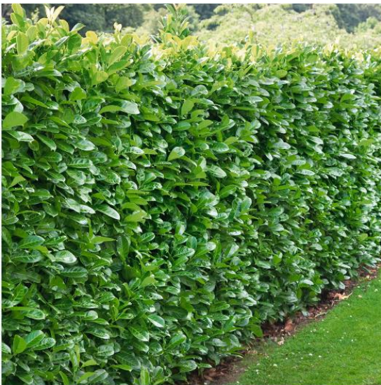
Figur 3 Laurbærkirsebær hæk

Plantning af planterne skal udføres af grundejerforeningens beboere, hvorfor jeg håber om opbakning til at bistå med dette.